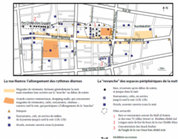
Fig. 3 : la « revanche » des rues adjacentes à la rue Hamra Beyrouth, avril-mai 2013.