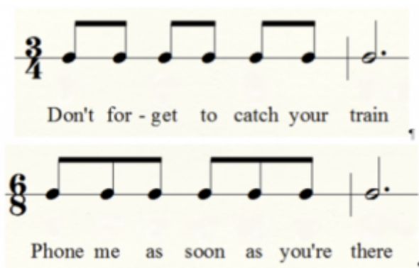
Figure 1. Exemple d'utilisation du langage pour l'enseignement des rythmes binaire et ternaire (Taylor 19)

dans la méthode de pédagogie de la musique appelée « la méthode Kodály » développée en Hongrie sous l'influence du compositeur et pédagogue Zoltan Kodály au milieu du vingtième siècle. De façon similaire, « La méthode Orff » développée dans les 1920s-1930s par le compositeur allemand Carl Orff, implique l'application des mots aux séquences rythmiques. Ces approches méthodologiques ont fait l'objet de nombreuses études empiriques comparatives (voir par exemple Colley, Persillen). L'approche d'Orff est largement acceptée comme outil pour sensibiliser les apprenants de solfège aux subtilités rythmique : par exemple, Taylor propose ces deux phrases pour exposer les différences entre des rythmes binaires et ternaires :